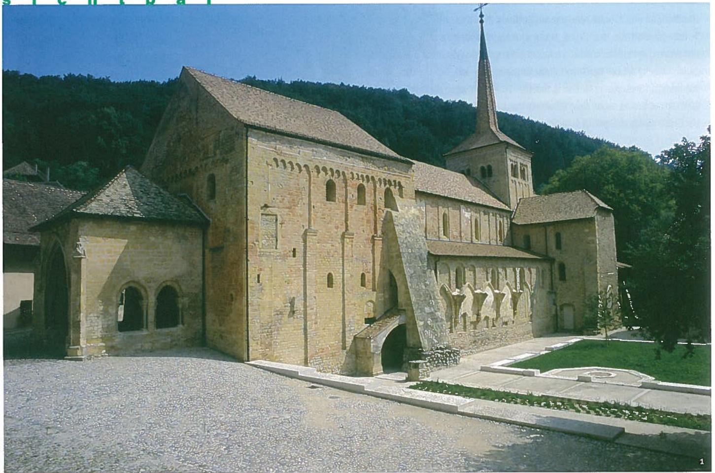
Abb. 1 Abtei von Romainmôtier (5. bis 15. Jh.).

La chiesa abbaziale di Romainmôtier (tra il V e il XV secolo).