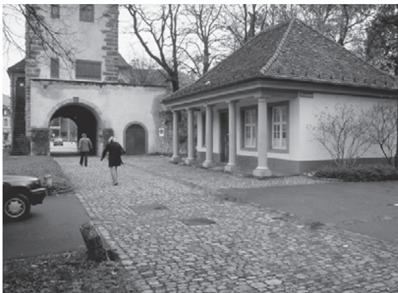
Abb. 9 (oben): Ländliche Zollhäuser unterschieden sich bis ins 19. Jahrhundert nur durch ihre Grösse von anderen repräsentativen Gebäuden wie Mühlen oder Gasthöfen. In der so genannten Wacht am östlichen Brückenkopf des Zunzgerbachs in Sissach, die 1703 erstmals erwähnt wird, war zuerst die Zollstelle und später die Dorfwacht untergebracht. Heute versammelt sich hier die Bürgergemeinde.