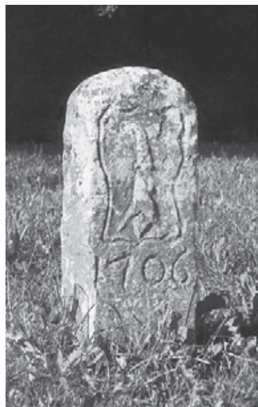
Abb. 8: Nach der Vermessung der neuen Staatsgrenze zwischen Basel und Bern im Jahr 1822 wurde auch der Glögglifels am mittelalterlichen Passweg zwischen Birseck und Laufental mit einer neuen Grenzmarke versehen. Ein kräftiger senkrechter Strich trennt die Wappen.