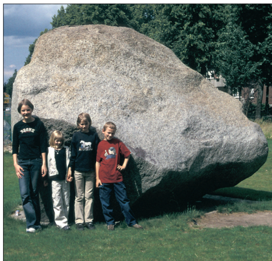
Abb. 1: Der „Gronauer Brocken“

Findlinge wurden von Menschen bereits in der Steinzeit für den Bau von Hünengräbern verwendet. Viele andere Blöcke sind in der jüngeren Vergangenheit bis in die Gegenwart hinein mangels fester Bausteine zu Pflaster- und Fundamentsteinen verarbeitet oder auch zur Errichtung von Mauern oder Denkmälern benutzt worden. Gerne stellt man sie auch in Vorgärten, Einfahrten oder in Anlagen auf. Die heute in Westfalen bekannten, meist als Naturdenkmale geschützten Großgeschiebe sind also nur noch die Reste einstmals recht zahlreicher Findlinge. Allerdings werden heute noch immer neue große erratische Blöcke gefunden – wie beispielsweise der am 3. Mai 1993 in einer Baugrube in der gleichnamigen Stadt entdeckte „Gro-