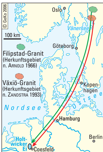
Abb. 3: Das Holtwicker Ei und seine vermuteten Herkunftsgebiete (Quelle: ARNOLD 1966, verändert u. erg.)

Die aus dem Norden vorrückenden saalezeitlichen Eismassen brachen aber nicht nur in Skandinavien Gesteine aus dem Untergrund heraus, sondern auch Gesteinsabfolgen der nordwestdeutschen Mittelgebirge (Wiehengebirge und Teutoburger Wald) und der nördlichen und zentralen Höhen der Westfälischen Bucht (Baumberge und Beckumer Berge). Diese werden in der Fachterminologie als einheimische Geschiebe bezeichnet. Die westfälischen Findlinge mit lokaler Herkunft bestehen ausnahmslos aus Sandsteinen (s. Abb. 2). Sowohl der „Dicke Stein“ von Ahlen (62,8 t/28,6 m 3 ) oder auch der Findling in Horstmar (44,7 t/20,3 m 3 ) sind hierfür eindrucksvolle Beispiele. Einzelne dieser Sandsteinsfindlinge haben den Charakter lokaler Leitgeschiebe, da sich ihre Ursprungsgebiete genauer identifizieren ließen.