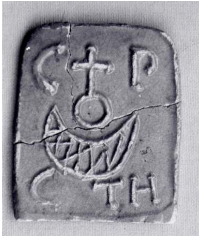
Zeuge aus dem Staatswald Lobenfeld/Wiesental, Ortsteil von Langenzell, um 1750. CP = Churpfalz, C TH = Carl Theodor. Heller Ton, hellgelb glasiert Maße: 6,5 x 5,5 x 0,3 cm.