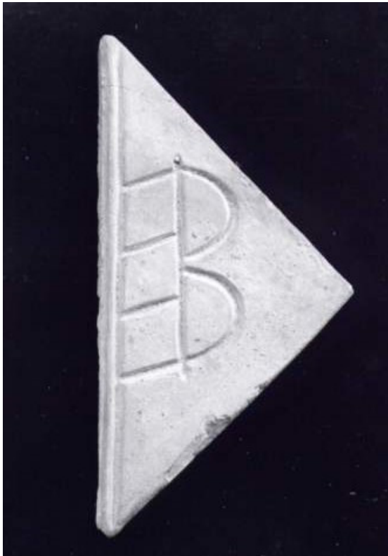
Hälfte eines Zeugen der Stadt Bretten 18. Jahrhundert. Roter Ton Maße: 13 x 9 x 9 cm.

Jahreszahlen auf Zeugen sind nicht so häufig und manchmal nicht mehr eindeutig lesbar. Ein Anhaltspunkt ist dann gewöhnlich die Jahreszahl des Steines, was vermutlich bei dem Oberndorfer Zeugen zur Datierung führte. Diese Methode ist aber keineswegs unfehlbar. Es ist schon vorgekommen, daß ein alter Stein angehoben und wieder befestigt wurde und dabei neue Zeugen unter seinen Fuß kamen.