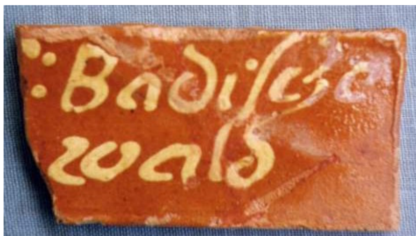
Zeuge aus der Gemarkungs- und Waldgrenze der Gemeinde Schönbrunn/Kolben. Aus drei Teilen zusammengesetzt und restauriert. Das linke fehlende Stück mit den Buchstaben G : H wurde nicht gefunden. Gebrannter Ton, braun glasiert, gelbe Inschrift. Maße: 8 x 4 x 0,6 cm.