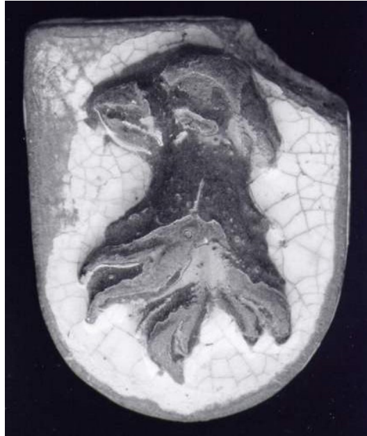
Zeuge der Stadt Freiburg i. Br. (Bisher sind von diesem Typ nur wenige Exemplare bekannt.) Braun und weiß glasiert. Auf der Rückseite steht die Jahreszahl 1835. Maße: 4 x 3 x 1 cm.