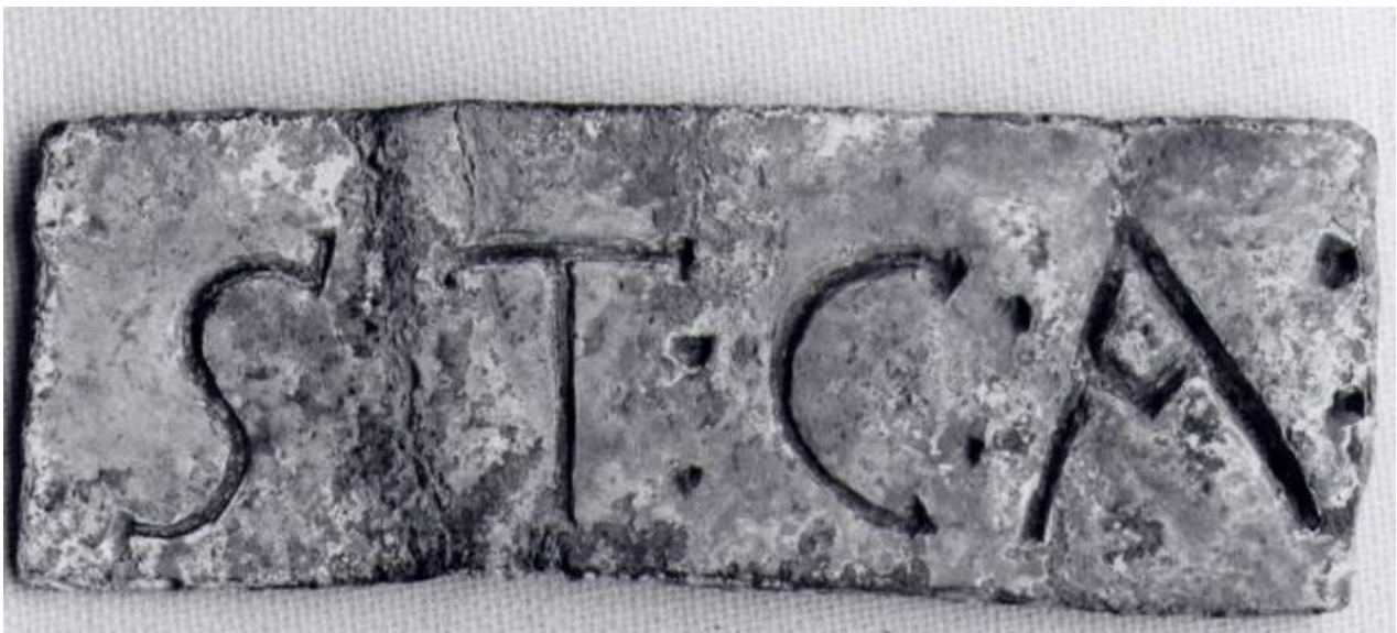
Zeuge der Gemeinde Schönbrunn, Rhein-Neckar-Kreis. Grenze Privatwald/Staatswald. Bleiplättchen, beigelegt 1768. ST: C: A: = Stüber Cent Allmend (wald). Maße: 7 x 2,5 x 0,1 cm.

In der neueren Literatur wird immer wieder behauptet, daß die Untergänger nur ehrenamtlich, also unentgeltlich arbeiteten. Ihrem Ehrenamt entsprechend habe man ihnen das als Auszeichnung anzusehende Essen und den Trunk gereicht. In einer Reihe früherer Vorschriften sind jedoch klare und genaue Angaben über ihre Bezahlung enthalten. So mußten nach der Badischen Landesordnung aus dem Jahre 1715 die Gemeinden den "geschworenen" Untergängern oder Märkern den ortsüblichen Lohn bezahlen. In der 1782 erschienenen Tübinger Gesetzessammlung heißt es in § 61, daß der Felduntergänger keine Besoldung, jedoch den bei den Feldsteußlern "gedachten" Taglohn erhält. Ergänzend wird dann 1786 bestimmt, daß die Untergänger für die Fälle, in denen die Steinsetzung keinen Tag erfordere, 20 Kreuzer erhalten. In Hessen erhielten die Steinsetzer für einen Tag 1/2 Viertel Wein oder 9 Albus und für jeden gesetzten Stein nochmals 3 Albus (Albus = Weißpfennig, eine Silbermünze). In Hanau bekamen die Landscheider für eine "Ausheischung" 5 Albus und für jeden gesetzten Stein 12 "Pfenning". Nach dem Solmschen Landrecht des Jahres 1612 erhielten die Landscheider vor einem Ausgang 1/2 Viertel Wein und für jeden gesetzten Stein wiederum 12 "Pfenning". Die Durlacher Untergänger bekamen im Jahre 1577 für die Ausmessung eines Morgens 1 Schilling und für jeden gesetzten Stein 8 "Pfenning". Die Reihe ließe sich fortsetzen.