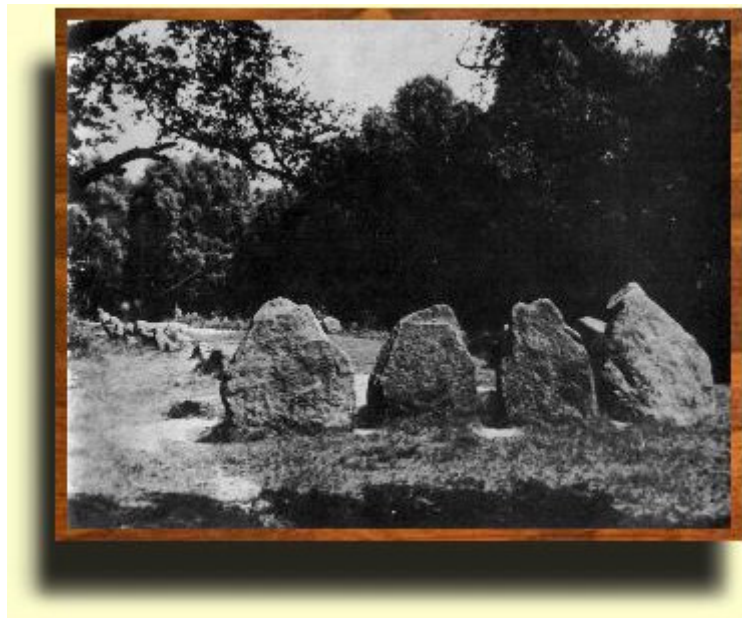
Abbildung 2: Visbeker Braut heute, mit mächtiger Fassadenreihe

Hünenbetten dieser Art kommen verstreut im ganzen weiteren Bereich der Megalithkultur in Westeuropa vor, insbesondere in den Küstengebieten von Holland, Dänemark, Südschweden, Norwegen, England, Schottland, Irland, Frankreich, Portugal und Spanien. Wegen ihrer verhältnismäßig guten Erhaltung haben die Oldenburger Denkmäler europäische Berühmtheit.