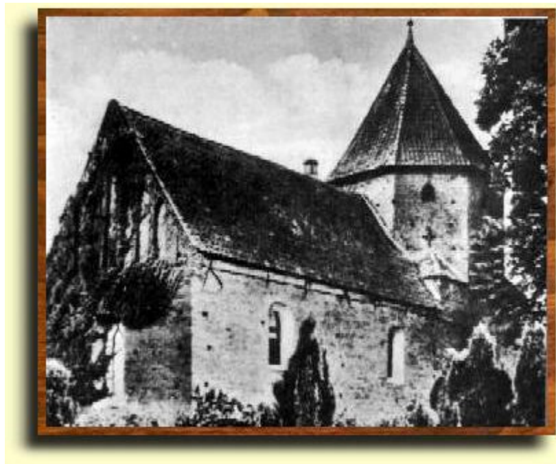
Abbildung 3: Kirche in Huntlosen

Die beiden Fassadenreihen von Braut und Bräutigam ragten aus den Reihen der übrigen Einfassungsblöcke sowohl nach Form und Größe deutlich heraus, sie waren deshalb für den sicher beabsichtigten Eindruck, als neuartige und achtunggebietende Kultbauten, bei den religiös zu gewinnenden Einheimischen besonders geeignet. Die damit erstmalig geschaffenen Weihe- und Totengedenkstätten waren bei dem begrenzten Steinvorrat baulich nur einmal möglich und darum später in gleichwertiger Großartigkeit nicht zu wiederholen. Aus diesem Grunde dürfen wir auch folgern, daß sie in unserem Raum mit zu den ältesten Denkmälern der Megalithkultur gehören. Das sollte unseren Denkmalschutz besonders verpflichten.