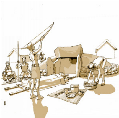
en mars 2010

Cette tombe collective a été érigée à la fin de l'époque néolithique, vers 2'300 ans av. J.-C. Cette "table de pierre" a sans doute été utilisée durant des centaines d'années pour y déposer les défunts. La tombe était fermée par une porte qu'il suffisait d'ouvrir pour y déposer de nouveaux corps.