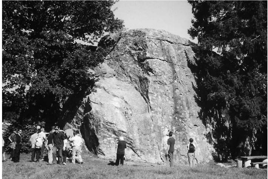
Abb. 2: Exkursion der Quartärforscher zu den Findlingen von Steinhof (8. September 2005)

seebecken ins erste KLN-Inventar aufgenommen worden, das heisst in das «Inventar der zu erhaltenden Landschaften und Naturdenkmäler von nationaler Bedeutung». 2 Über die Geschichte des Findlingsschutzes im Kanton Bern orientiert die jüngst erschienene Arbeit von Maurer. 3 Die Teilnehmer der Exkursion waren von der reichgestalteten Landschaft und insbesondere auch von der Grösse der Findlinge beeindruckt. Auf grosses Interesse stiessen ebenfalls die erstmals 2004 an Gesteinsproben von erratischen Blöcken von Steinhof und des Steinenbergs durchgeführten Altersbestimmungen. 4